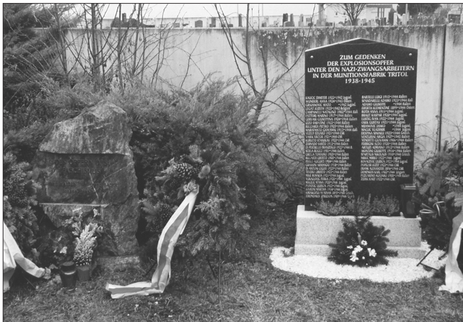
Friedhof Eggendorf: Gedenksteine für Opfer des Faschismus und für die Explosionsopfer in der Munitionsfabrik