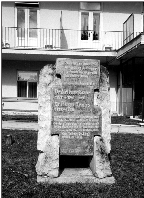
Gedenkstein in Feichtenbach

Kulturreferat der Marktgemeinde Pernitz 2. Juli 1994