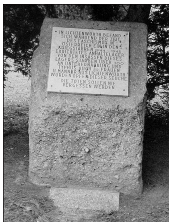
Gedenkstein in Lichtenwörth