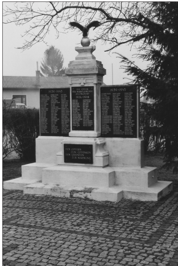
Kriegerdenkmal in der Ortsmitte von Zillingdorf